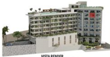
VISTA RENDER MI S Vallarta Nayarit Compostela